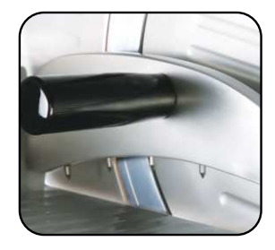
Pressamerce in alluminio protetto con ossidazione anodica.