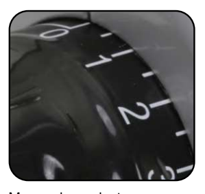
Manopola graduata per un taglio preciso.