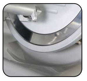
Linea arrotondata priva di spigoli.