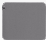
Tappetino per mouse igienizzabile HP 100 8X594AA