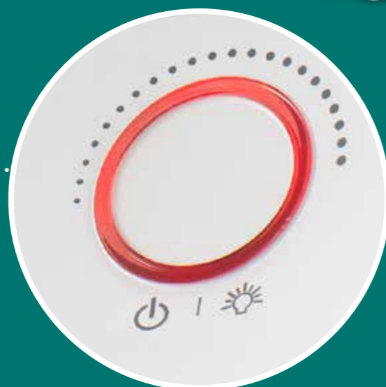
MANOPOLA RETROILLUMINATA MULTIFUNZIONE