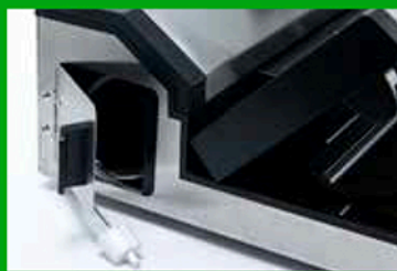
Vano laterale con sportello per riporre il tubetto flessibile in gomma con raccordi per confezionare sottovuoto in contenitori.

Compartment (with cover) for roll/bags for vacuum packing.