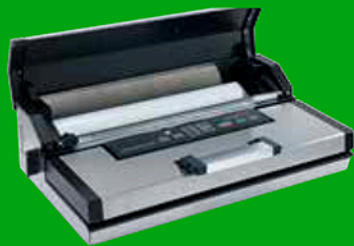
Vano (con coperchio) per rotolo/sacchetti per confezionare sottovuoto.

Compartment (with cover) for roll/bags for vacuum packing.