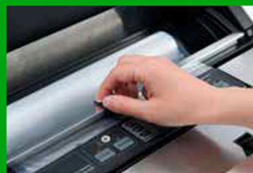
Barra di scorrimento e taglierina per realizzare il sacchetto della lunghezza desiderata.

Side compartment with door for storing the flexible rubber hose with fittings for vacuum packing in suitable containers.