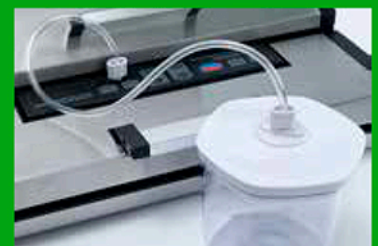
Tubetto flessibile in gomma completo di raccordi per confezionare sottovuoto gli alimenti non solidi. Non sono inclusi nella confezione gli appositi contenitori, vasetti con coperchio e bottiglie con apposito tappo.

Sliding bar and cutter to make the bag with the wished length.