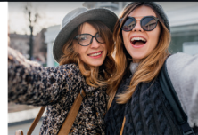
Nero: POLSP02B / 084102198706