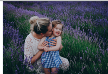
Bianco: POLSP02W / 084102198690