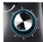
6 velocità + PULSE 6 speed + PULSE