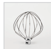
Frustra sbattitrice Beater