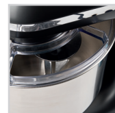
Contenitore in acciaio inox Coperchio con apertura Stainless steel bowl with lid