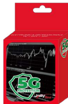
Imballo 14 x 12 x 5 cm Confezione 25 pz.